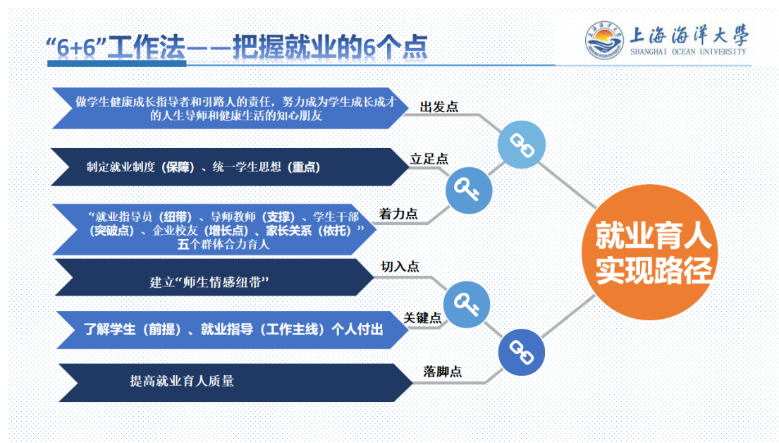
图3 研究生就业育人路径图

就业制度是保障，思想统一是重点。建立就业工作超前启动制度、就业工作例会制度，定期就业指导推进会、未就业学生沟通指导制度、“一生一档、一生一策”的分类指导制度等一系列制度。针对选择不同去向的毕业生开展“一对一”、“点对点”精指导，力促学生顺利就业、满意就业和高质量就业。此外，通过主题党日、主题团日、学生干部工作例会、研究生会例会等形式，贯彻好落实好学校、学院就业指导思想。针对“不就业、懒就业、慢就业”的现象，撰写《关于“营造热火朝天、你追我赶的就业氛围，争取不让一个同学掉队”的倡议书》。以倡议书为载体，统一思想，凝心聚力，营造积极向上的就业生态、舆论导向，达成“就业路上，一个同学不能掉队，一个都不能少”的目标。